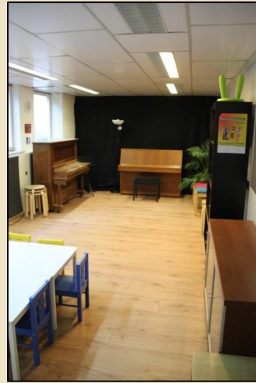
Pianoraum - Trudering