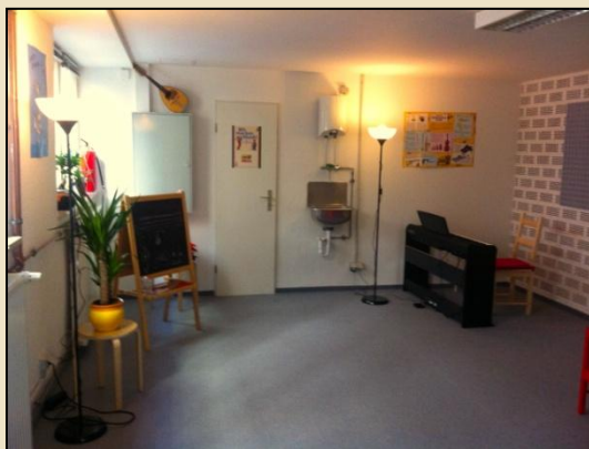
Musikboxzwerge – Schwabing