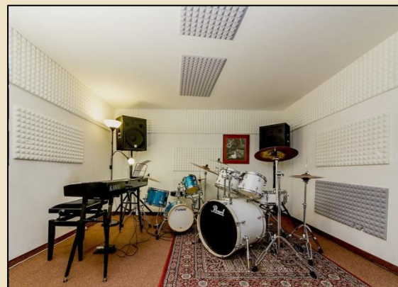
Drumstudio – Schwabing