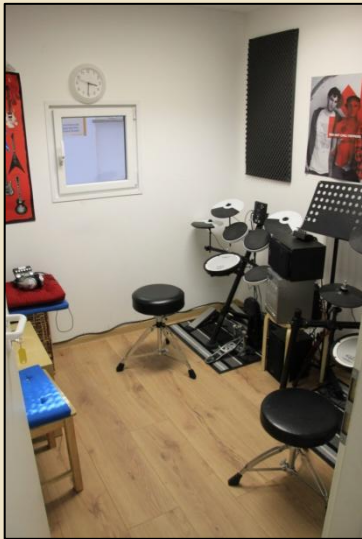
E-Drum-Studio – Trudering